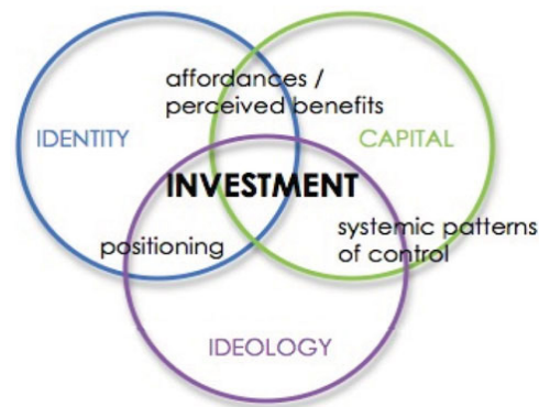
Figura 1 - Modelo de Análise do Investimento (Darvin; Norton, 2015)

Os autores debatem a noção de ideologia com base no trabalho de Bourdieu (1987) entendendo-a como um grupo de ideias normativas que têm o poder de inculcar ou impor princípios de construção da realidade, construindo, assim, verdades. Tais ideias são geralmente arbitrárias e legitimadas pela autoridade outorgada a quem as propõe, autoridade essa permeada por relações de poder invisíveis a muitos uma vez que ideologias tendem a se naturalizar, aparentando-se fruto do senso comum. Para além da naturalização, as ideologias têm forte poder de