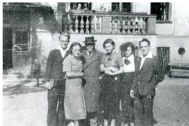
Figura 4 - Janusz Korczak com os redatores do jornal Mały Przegląd .