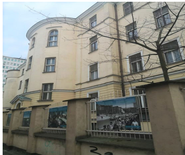
Figura 10 - Hospital Infantil Bersohn e Bauman.