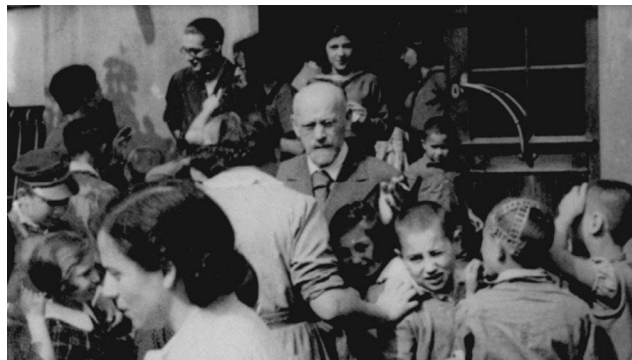
Figura 3 - Janusz Korczak com as crianças numa apresentação de teatro.

Fonte: Instituto de História Judaica, 18 jul.1942.