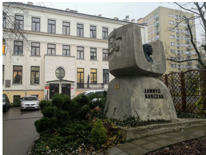
Figura 5 - Dom Sierot