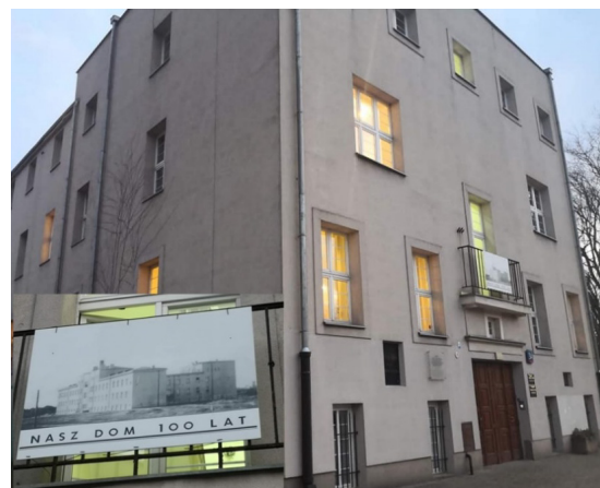
Figura 8 - Nasz Dom em Bielany.

Após o fim da Grande Guerra, Varsóvia tentava voltar ao seu posto de capital do país e a cidade começava a se reerguer sob o aspecto de uma capital moderna da Europa. Muitas crianças órfãs foram trazidas para a capital, mas não havia espaço para abrigá-las. Portanto, em 1919, após retornar à cidade, Korczak reuniu forças com Maryna Falska e Maria Podwysocka para fundar um centro de educação para crianças, filhos e filhas de civis e militares poloneses, a quem a guerra tirou a vida. Diante desse contexto, em 15 de novembro de 1919, foi inaugurado Nasz Dom (Nosso Lar). Primeiramente em Pruszków , região metropolitana da capital e anos mais tarde, em 1927, a casa com apoio da recém primeira-dama Aleksandra Piłsudska, ganhou novo espaço num prédio novo de três andares no bairro de Bielany em Varsóvia, para onde as crianças foram transferidas.