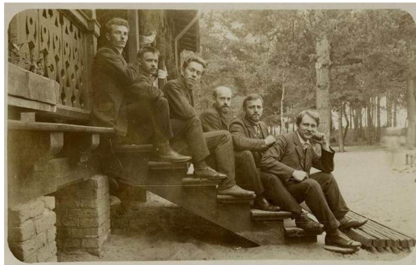
Figura 11 - Janusz Korczak (o quarto de cima pra baixo) entre os tutores da Colônia de Férias Wilhelmówska para crianças polonesas.

arredores de Varsóvia, com o passar do tempo, os rementes se tornavam mais distantes, com cartas da Austrália, México, Brasil, China, Uruguai, Bolívia, Palestina, além de outros países da Europa, o que também demonstra uma grande onda de emigração. A paz em tempos de guerras era almejada, e assim a cada novo número do jornal Mały Przegląd , mais leitores e cartas eram acumuladas, recheadas de alegrias, tristezas, angústias, sonhos e medos, mas que, ao serem publicadas, regozijavam seus autores.