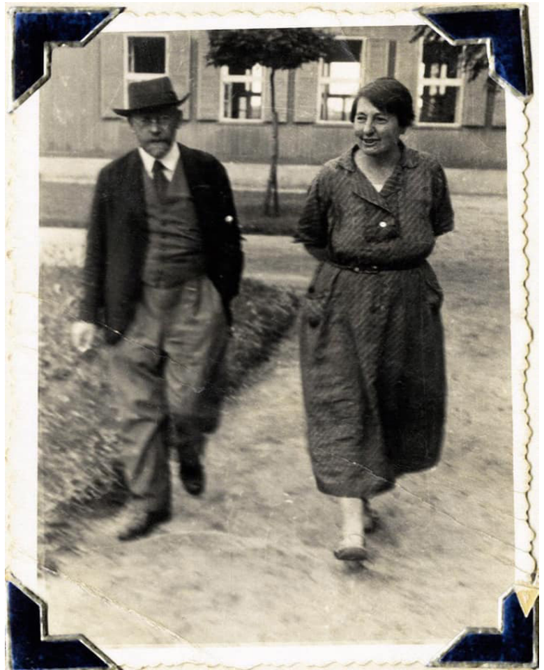
Figura 2 - Janusz Korczak e Stefania Wilczyńska em Goctawk.