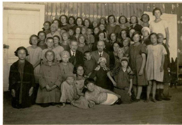
Figura 6 – Janusz Korczak e Stefania Wilczynska rodeada pelos moradores do orfanato.

Dom Sierot visava comportar 107 crianças de 7 a 14 anos, mas nos anos que sucederam a inauguração do prédio, esse número costumeiramente ultrapassava seu limite 7 . Desde o início, o edifício foi projetado como uma instituição de ensino e pesquisa em educação, onde além de comportar a educação das crianças, também era um espaço para a formação de professores, especialmente pedagogos em formação que encontravam na instituição um espaço para estágios e monitorias.