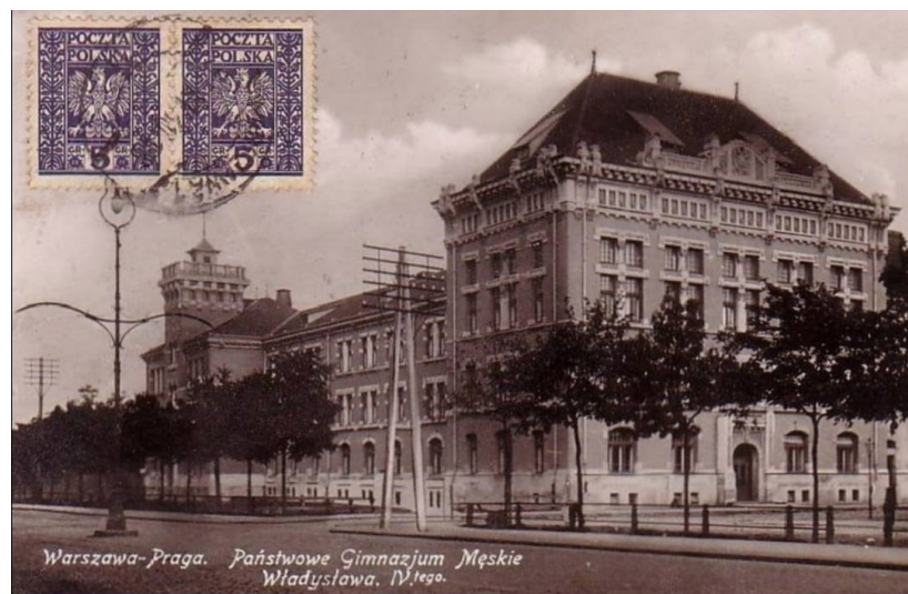
Figura 9 - Ginásio masculino do bairro de Praga/Varsóvia.

Aos oito anos, Henryk Goldszmit começou a estudar na escola primária Augustyn Szmurła, na Rua Freta, em Varsóvia. Sobre esta experiência, mais tarde ele escreve, “esmagaram um aluno lá”, referindo-se à humilhação que viu quando um colega de sala foi achincalhado pelos professores. Ao experienciar algumas situações de castigos corporais nas escolas, fez da escola a sua adversária. Mais tarde, entre os anos de 1886-1897, Henryk se mudou para o colégio masculino, no bairro de Praga, em Varsóvia.