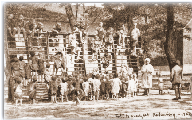
Figura 6 - Crianças no parque na Casa da Rosinha