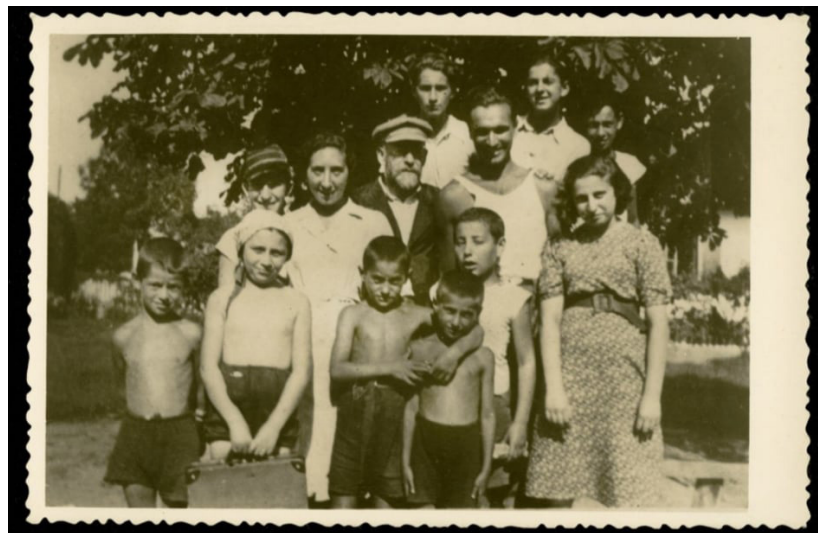
Figura 7 - Janusz Korczak com monitores e algumas crianças na "Casa da Rosinha".

Em setembro de 1939, toda a região de Wawer foi ocupada pelos nazistas, sob a tutela de Adolf Hitler e Heinrich Himmler que assistiam desde a torre da Igreja de Nossa Senhora da Coroa Polonesa (Matki Boskiej Królowej Korony Polskiej), um dos pontos mais altos da cidade. Apesar do bairro ser devastado, o prédio da Casa da Rosinha suportou a Guerra e permaneceu como espaço de cultura até o final da década de 1960, quando o prédio foi demolido. Atualmente encontramos no local, o centro poliesportivo "Syrenka" no bairro de Wawer, em Varsóvia.