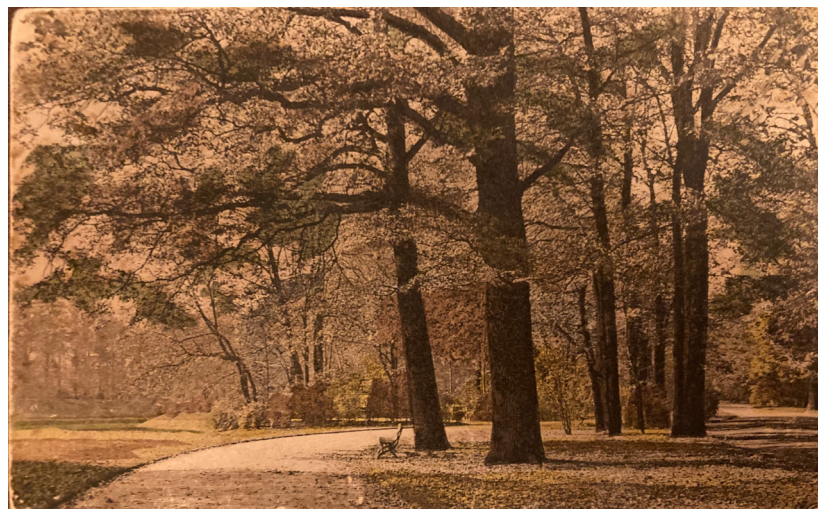
Figura 1 - Cartão postal recebido de Janusz Korczak por ter se levantado cedo durante 91 dias consecutivos.