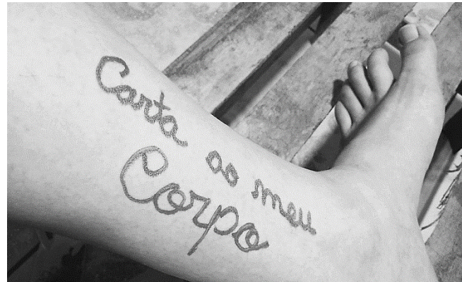
Figura 2 – ao meu corpo.