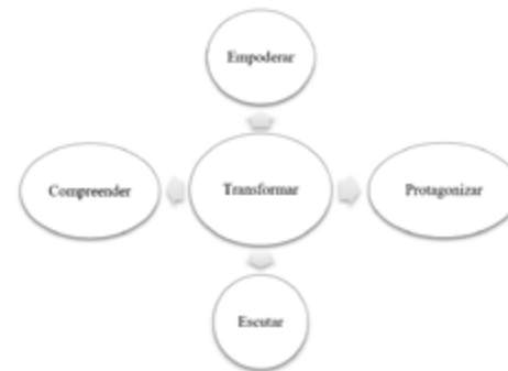
Figura 2 - Desenho metodológico do Curso