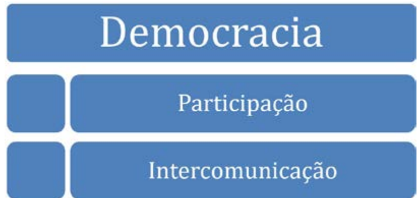
Esquema 1 - correlatos de diálogo em Paulo Freire