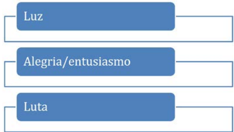
Esquema 2 - Correlatos de Esperança em Paulo Freire