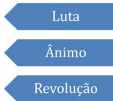
Esquema 3 - Correlatos de amorosidade em Paulo Freire