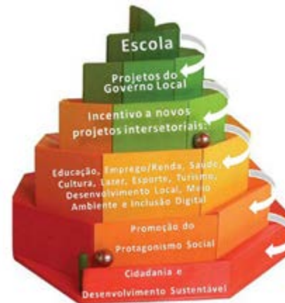
Figura 01 – Cidade Educadora: espiral da inclusão, cidadania e sustentabilidade

Fonte: https://sites.google.com/site/ecosistemaemrede/cidade-educadora . Acesso: 18/07/2022.